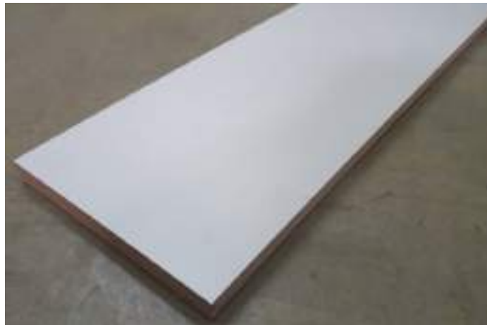
Fotografia 2 – Material ensaiado