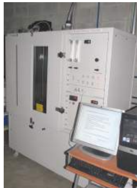
Fotografia 1 – Câmara de ensaio

Os resultados do ensaio estão apresentados nas formas tabular e gráfica neste relatório. De acordo com a norma, os ensaios são conduzidos até um valor mínimo de transmitância ser atingido, agregando-se, no mínimo, um tempo adicional de ensaio de três minutos, ou até o tempo máximo de ensaio de 20 minutos, o que ocorrer primeiro.